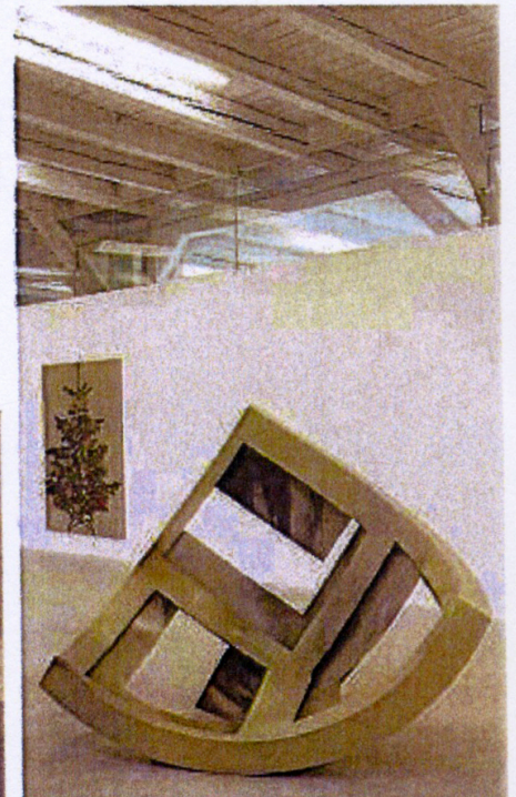
Im Kunstzeughaus zu sehen ist der «Club-sessel» von Urs Cavelti.